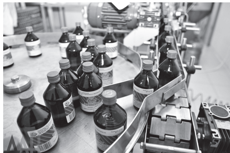
Правительство РФ предлагает установить госпошлину за выдачу лицензии на производство этилового спирта, который используется в фармацевтике.

Среди предложений кабинета - исключить положение, позволяющее обойти запрет на применение